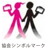
協会シンボルマーク

公益財団法人 安全衛生技術試験協会 九州安全衛生技術センター 〒839-0809 福岡県久留米市東合川5丁目9番3号 TEL 0942-43-3381 FAX 0942-44-0844 https://www.kyushu.exam.or.jp/